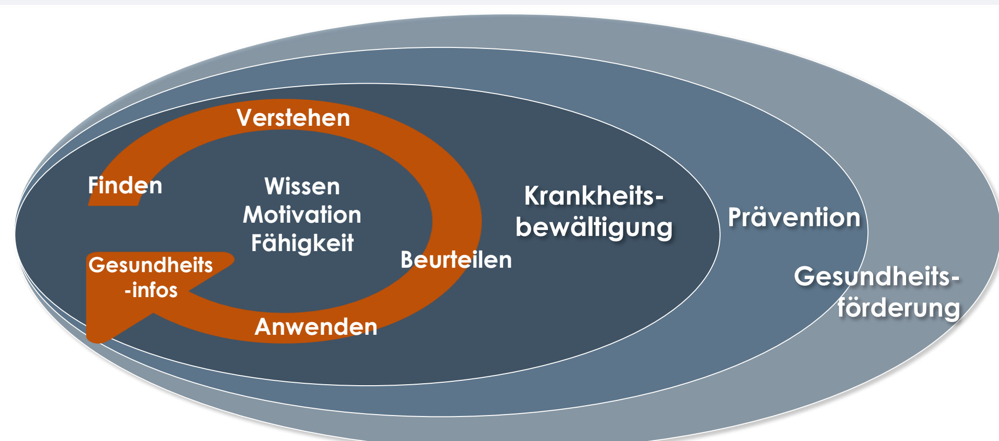
Abb. 1: Konzeptuelles Modell der GK (in Anlehnung an Sørensen et al., 2012).

Limitierte Gesundheitskompetenz (GK) wird mit einer Reihe negativer Gesundheits-Outcomes assoziiert (Berkman et al., 2011). Für Menschen mit Knie- oder Hüfttotalendoprothesen (KTEP/HTEP) nimmt der Faktor GK eine besondere Bedeutung ein. Während der orthopädischen Rehabilitation sind Betroffene mit zahlreichen Gesundheitsinformationen konfrontiert. Ziel ist die Steigerung von Handlungskompetenzen bzw. Selbstmanagement im Alltag (Gyimesi et al., 2016). GK ist zentrale Voraussetzung für ein wirksames Selbstmanagement (Bitzer & Spörhase, 2015). Die systematische GK-Erfassung hat zur Erkenntnis geführt, dass sich der Gesundheitszustand durch diesen Faktor besser vorhersagen lässt als anhand klassischer sozio-demographischer Determinanten, wie Bildung oder Einkommen (Wu et al., 2010). Über die GK von Personen mit KTEP/HTEP und deren Einfluss auf klinische Outcomes gab es bislang jedoch kaum wissenschaftliche Evidenz.